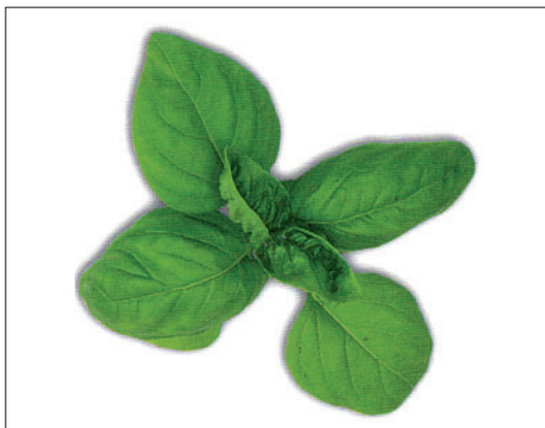
Abb. 28 Basilikum, Königskraut ( Ocimum basilicum )