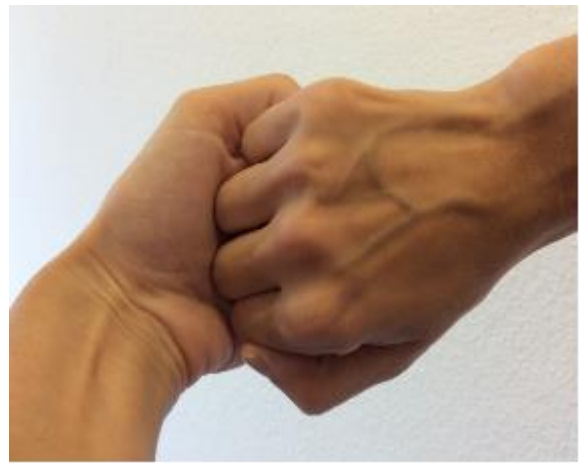
4. Handfläche auf Handfläche mit geschlossenen Fingern