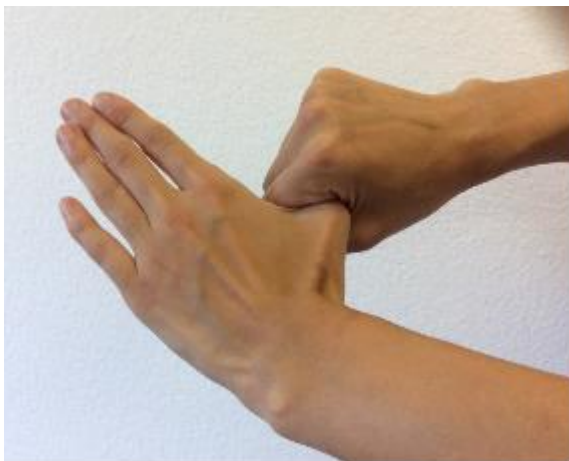
5. Rechter Daumen mit der geschlossenen linken Handfläche und umgekehrt