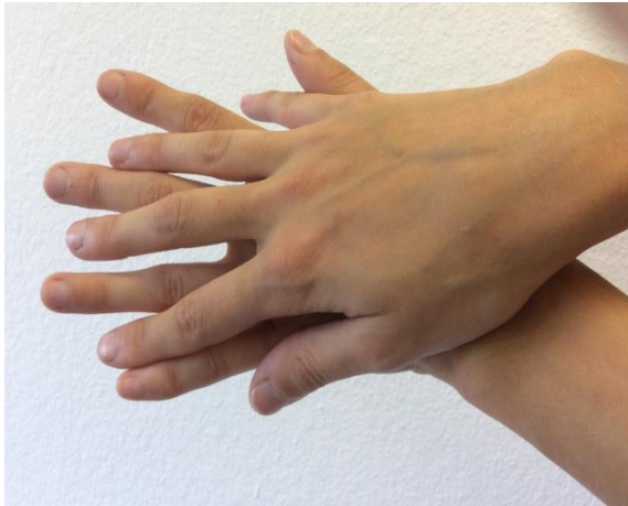
1. Handfläche an Handfläche, Handgelenke beachten!