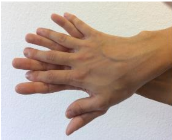
3. Handfläche auf Handfläche mit gespreizten Fingern