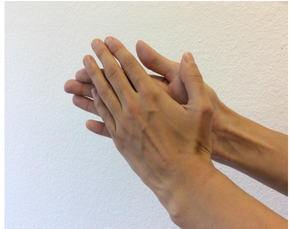
2. Rechte Handfläche über linken Handrücken und umgekehrt