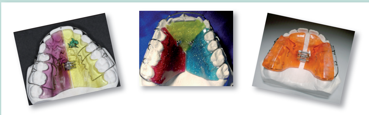
Beispiele für Einzelkiefergeräte