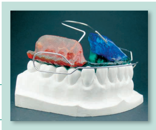
Abb. 1 Bionator-Grundgerät nach Balters