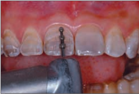
Bild 3 Mit einem Tiefenmarkierbohrer wird die korrekte Präparationstiefe für die dünnen Keramikveneers festgelegt.