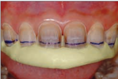
Bild 5 Visualisierung der notwendigen horizontalen Reduktion der Schneidekanten