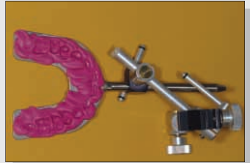
Bild 8 Transferbogen zur schädelbezüglichen Registrierung der Lage des Oberkiefers