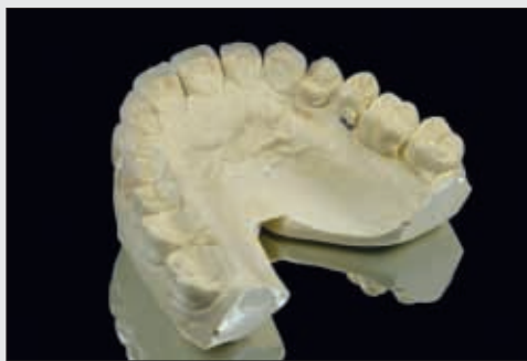
Bild 11 Fertiggestellte Keramikveneers auf dem Modell (orale Ansicht)