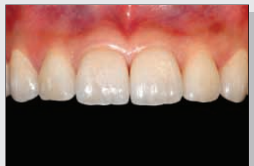
Bild 14 Endsituation: Die Keramikveneers stellen die Funktion und Ästhetik der Zähne im Oberkiefer wieder her.