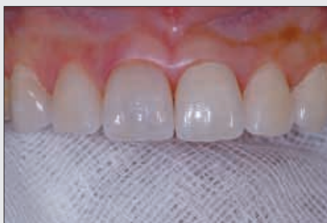
Bild 13 Einprobe sämtlicher Veneers. Die Veneers werden gegen ein Herabfallen oder Verschlucken mit Gaze gesichert.