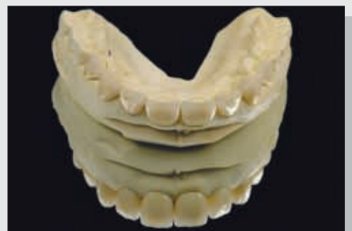
Bild 10 Fertiggestellte Keramikveneers auf dem Modell (labiale Ansicht)