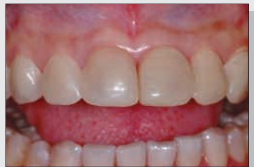
Bild 12 Am Einsetztag erscheint die Patientin wieder mit ihren Provisorien.