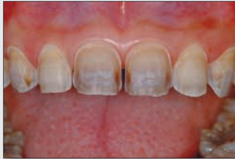
Bild 4 Die Präparation wird durch Abtragen der Schmelzanteile zwischen den Markierungen weitergeführt.