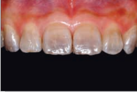
Bild 1 Ausgangssituation: dunkel und unästhetisch wirkende Frontzähne im Oberkiefer aufgrund von Tetrazyklineinlagerungen in die Zahnhartsubstanz

Veneers werden im Oberkiefer häufig nicht nur einzeln, sondern über mehrere benachbarte Zähne im Frontzahnbereich eingesetzt. Mit den dünnen Verblendschalen aus Keramik kann im Vergleich zur kompletten Überkronung der Zähne ein ästhetisches Problem zahnhartsubstanzschonend therapiert werden.