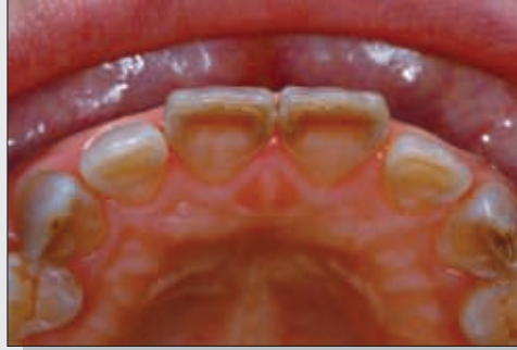
Bild 2 Ansicht aus inzisaler Richtung. Sämtliche Frontzähne des Oberkiefers werden in die Therapie einbezogen.