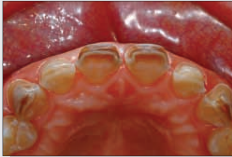
Bild 7 Ansicht aus inzisaler Richtung. Man erkennt deutlich die Einkürzung der Zähne.