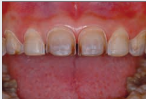
Bild 6 Fertiggestellte Veneerpräparationen mit Reduktion der Schneidekanten zur Erzielung einer inzisalen Transluzenz