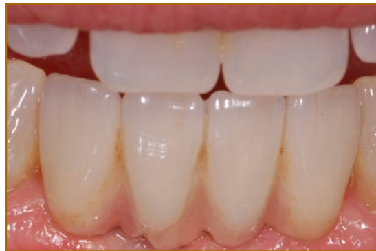
Abb. 3: Defektverschleierung