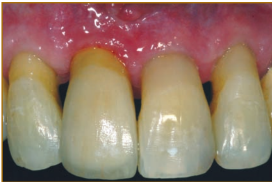
Abb. 2: Zahnhalsmodellation

Diese Augmentationstechniken können sowohl einzeln, als auch in Kombination miteinander angewandt werden und sind um die große Palette der Weichgewebschirurgie zu ergänzen.