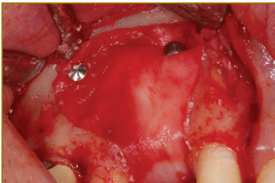
Abb. 4: Augmentation