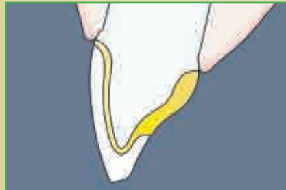
Metallkeramikkrone mit Keramikschulter